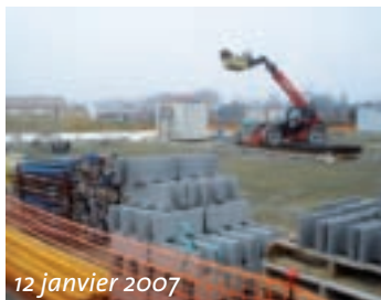
12 janvier 2007

La construction de la crèche de Bretx : livraison mi juillet !