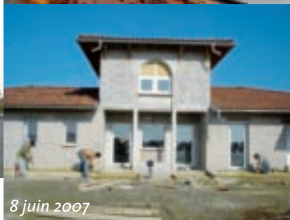
8 juin 2007