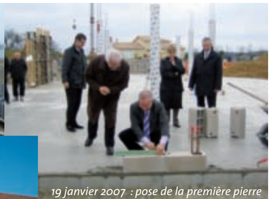
19 janvier 2007 : pose de la première pierre