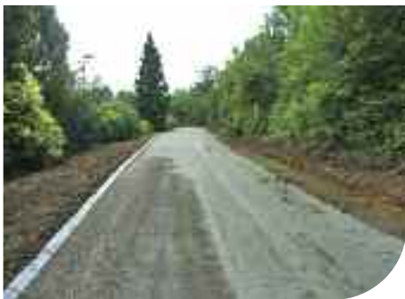
Travaux chemin du Ratelier-Août 2010