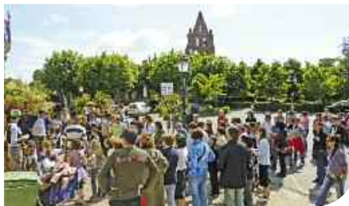
Mai(s) ma Parole, du 11 au 22 mai 2011