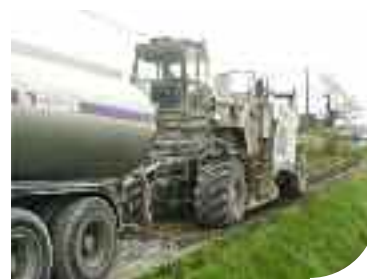
Retraitement en place à froid des anciennes chaussées

Avec le fauchage raisonné, le retraitement à froid des anciennes chaussées et l'utilisation de produits bitumineux plus respectueux de l'environnement, la CCSG entame la démarche de « route durable » souhaitée par les élus communautaires, et inscrite dans l'Agenda 21.