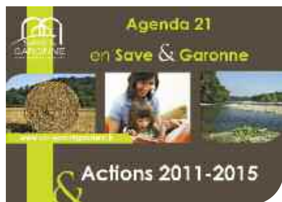
Plan d'actions. A consulter sur www.cc-saveetgaronne.fr

maison économe en énergie. Les dates et lieux sont annoncés sur le site Internet de la CCSG et dans les journaux locaux.