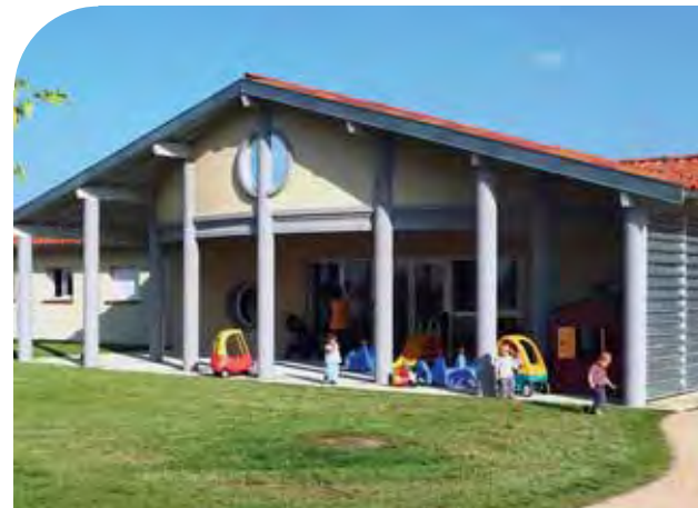
Crèche intercommunale de Merville