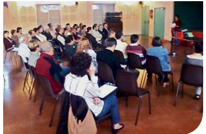
Réunion publique au Burgaud.

Durant deux mois (automne 2009) ces ateliers se sont réunis pour faire un état des lieux et des propositions sur cinq grands thèmes: Préserver notre environnement, Vivre ensemble, Être solidaires, Créer et produire et Penser notre territoire.