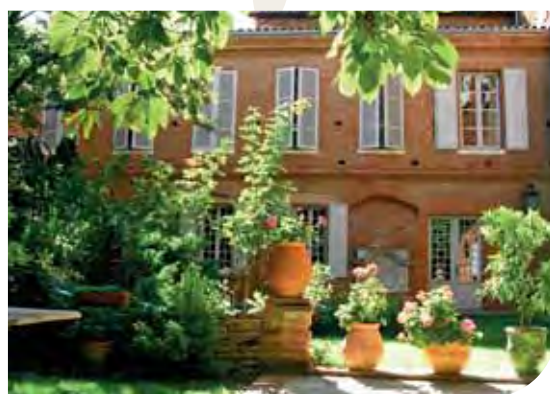
Ancien couvent des Ursulines à Grenade