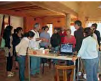
Atelier compostage – mai 2010

Nous proposons aussi des formations et serons présents sur certains marchés.