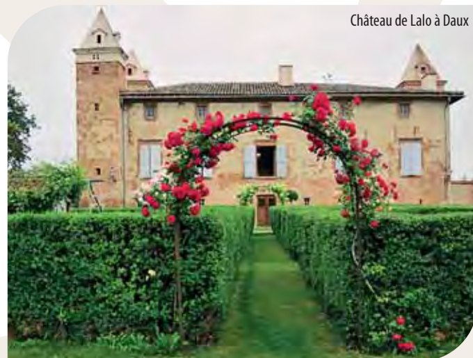
Château de Lalo à Daux

Port du casque conseillé. Parcours facile d'environ 12km. Apporter une bouteille d'eau.